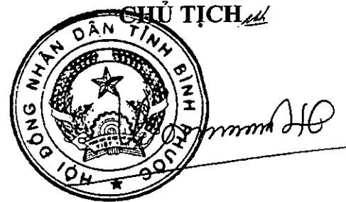
Trần Tuệ Hiền